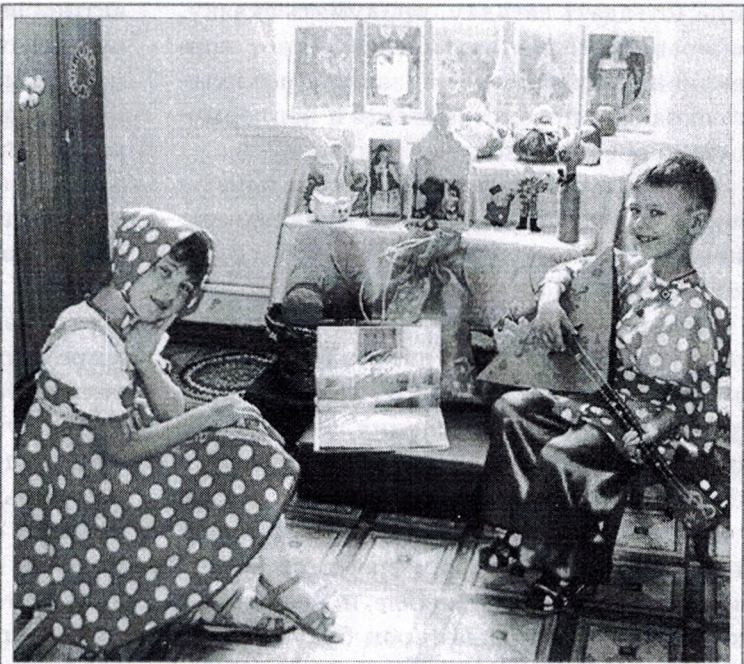
Мини-музей «У Лукоморья»

в мини-музее «Казачье подворье» экспонатами стали предметы кубанского быта. Расположили мини-музей под открытым небом. На одной из стен павильона нарисовали речку и камыш, под деревом (как и положено на Кубани) поставили печку, расписанную Петриковской росписью,